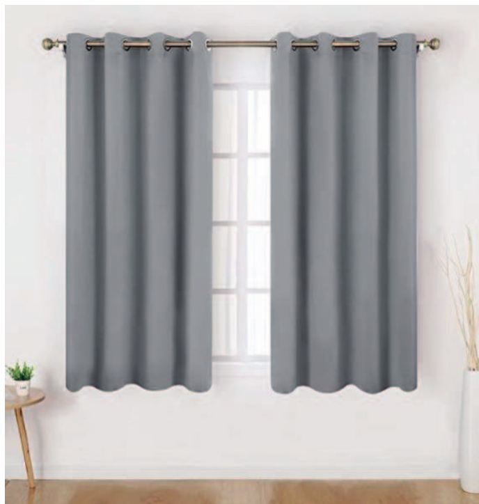
Cortina para ventana