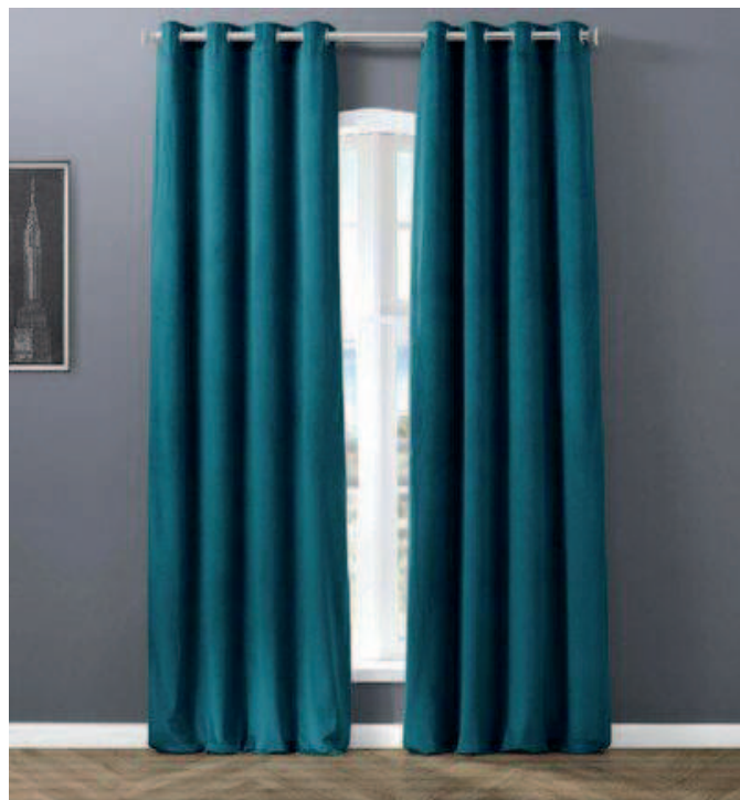
Cortina para mampara