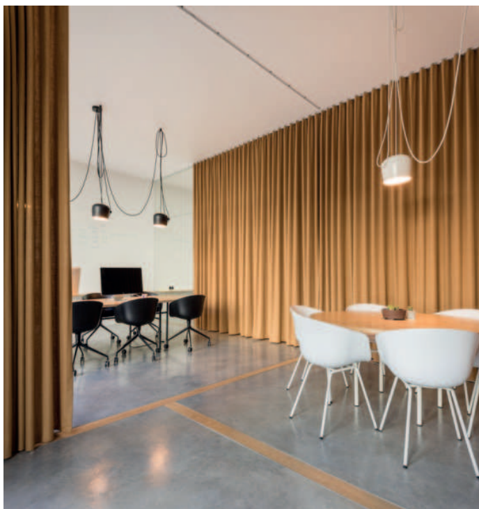
Cortina para división sala de reuniones