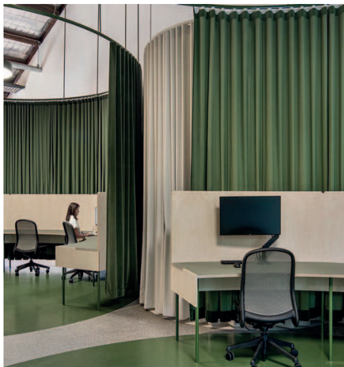
Cortina para división de estaciones de trabajo